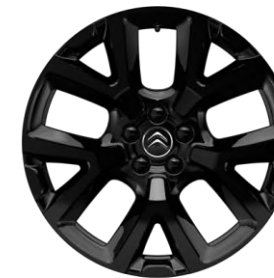
Jante aliaj Full Black 19" ART (Tall & Narrow) (205/55 R19) (ZHY9)