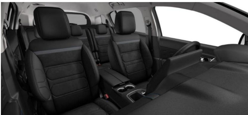
Tapiterie mixta Urban Black (0JFD)