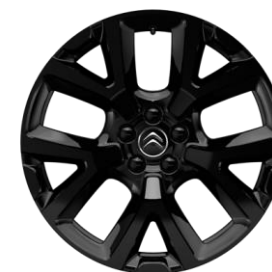
Jante aliaj Full Black 19" ART (Tall & Narrow) (205/55 R19) (ZHNY)