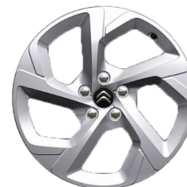
Jante aliaj 18" SWIRL (Gris Eclat Brillant) (225/55 R18) (ZHC7)