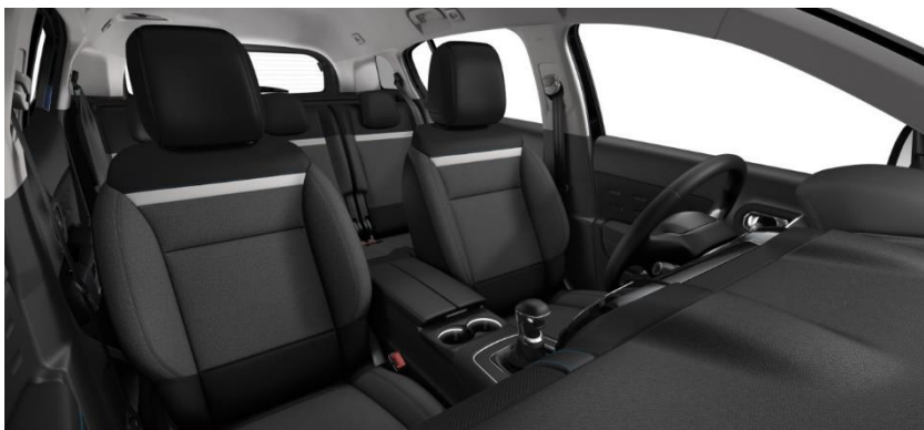
Tapiterie textila Silica Grey (51FR)