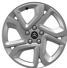
Jante aliaj 17" ELLIPSE (215/65 R17) (ZHHC)