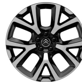
Jante aliaj diamantate 19" ART (Tall & Narrow) (205/55 R19) (ZHJL)