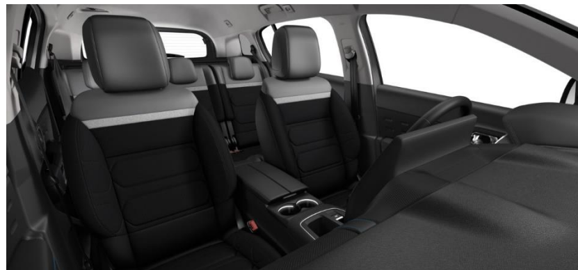
Tapiterie mixta Wild Black (V4FC)