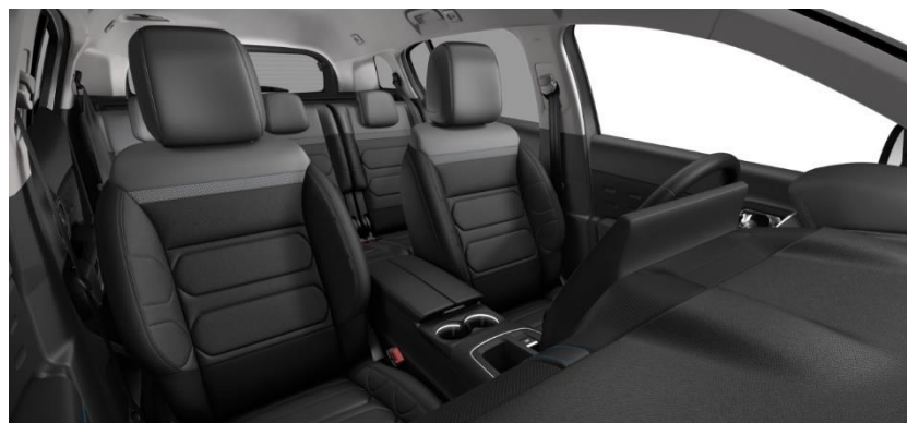
Tapiterie mixta Metropolitan Black (TKFF)