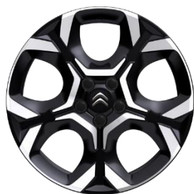
Jante aliaj diamantate 18" PULSAR (225/55 R18) (ZHXI)