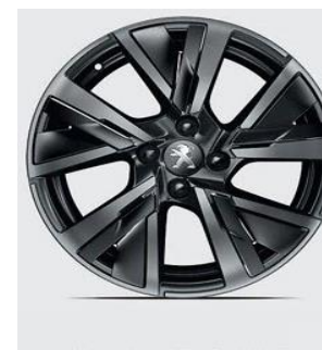
Jante Alu 17" BRONX