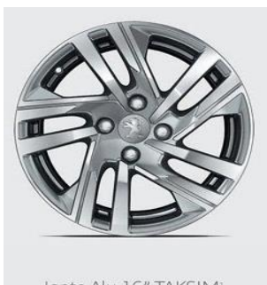
Jante Alu 16" TAKSIM