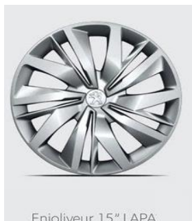
Enjoliveur 15" LAPA