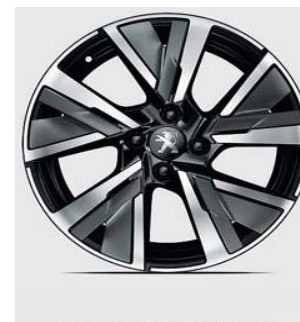
Jante Alu 17" CAMDEN