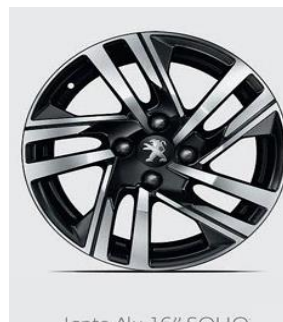
Jante Alu 16" SOHO