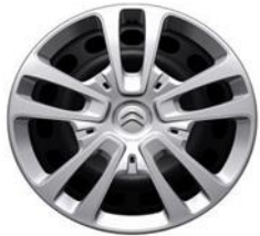
Jante table negre 16" cu capace (215/65 R16)