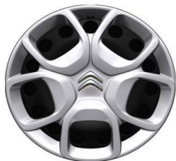
Jante tabla negre 17" cu capace (215/60R17)