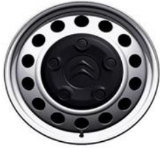
Jante tabla gri 16" (215/65 R16)